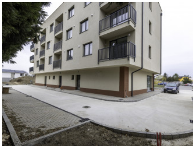
1izb Byt A-2NP - 61,93m 2 2izb Byt B-2NP - 55,26m 2 2izb Byt C-2NP - 56,48m 2 3izb Byt D-2NP - 70,16m 2